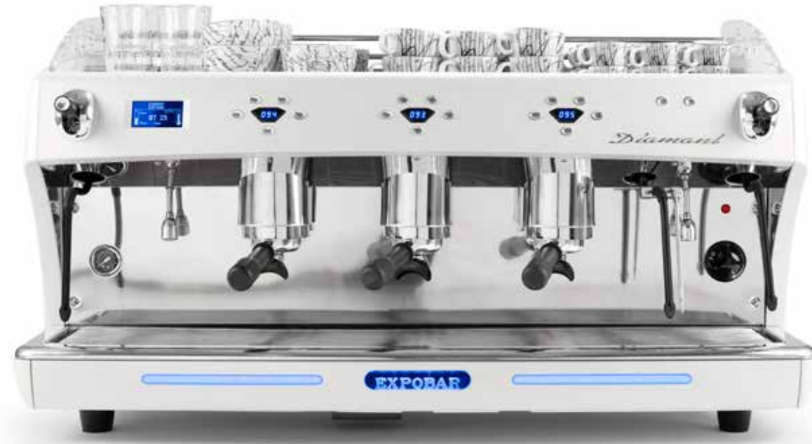
Tävlingsmaskin Barista Cup 2010, 2012