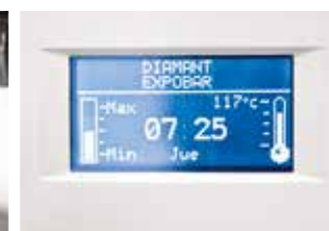
Den elektroniska kontrollpanelen ger värdefulla data, bland annat om vattennivån i ångtanken