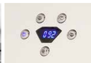
Digital visningsdisplay för temperatur i brygggrupp